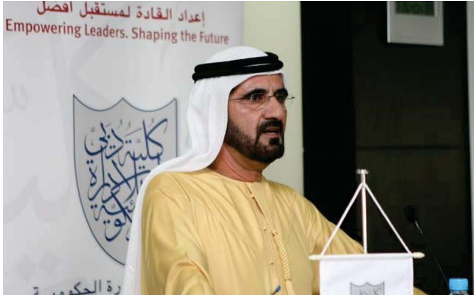
HH Sheikh Mohammed bin Rashid Al Maktoum

Launched in 2005 under the patronage of His Highness Sheikh Mohammed Bin Rashid Al Maktoum, Vice-President and Prime Minister of the UAE and Ruler of Dubai, the Mohammed Bin Rashid School of Government is the first research and teaching institution focusing on governance and public policy in the Arab world. The school aims to support the ongoing efforts for governmental excellence in the UAE and the Arab world, and empower leaders to build the future through an integrated system offering education and training programs, as well as research and studies.